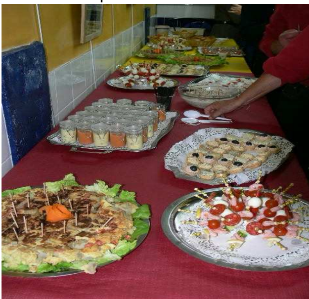
22H01 Les Tapas du traiteur Sterffe