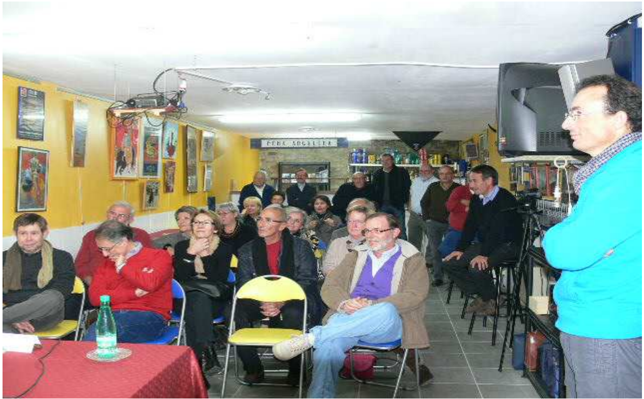
35 socios écoutent religieusement...

Il n'y pas de trucage pour la couleur du pull del Claudio !!!